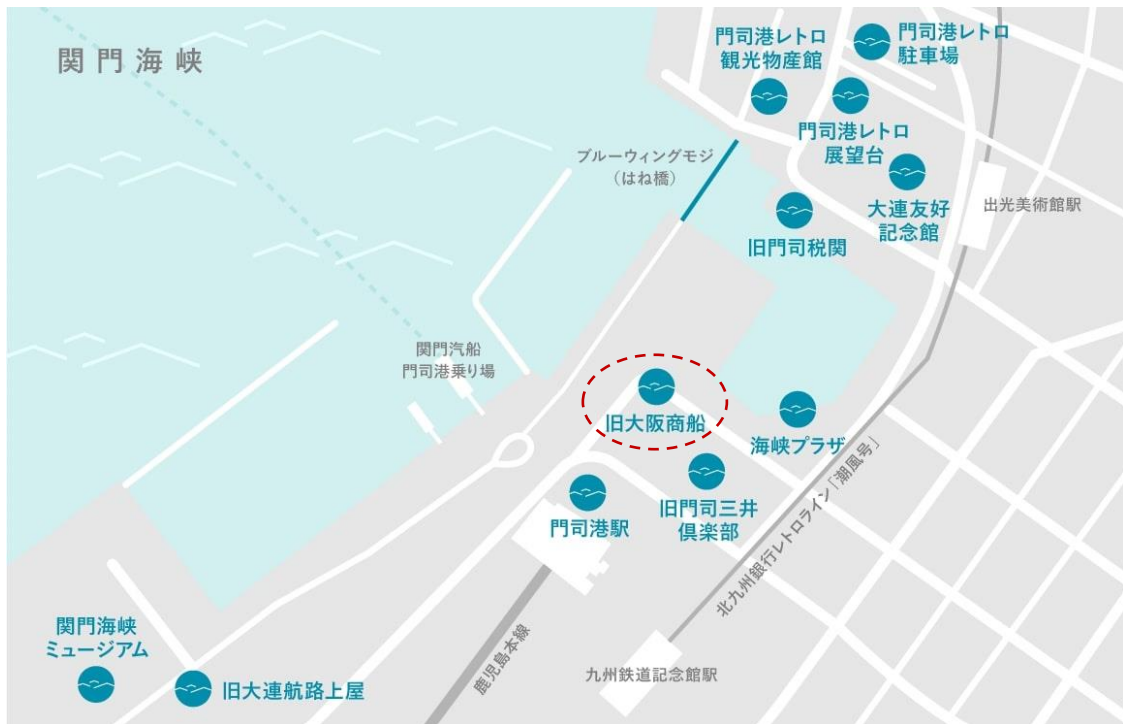
旧大阪商船 北九州市門司区港町 7 番 18 号