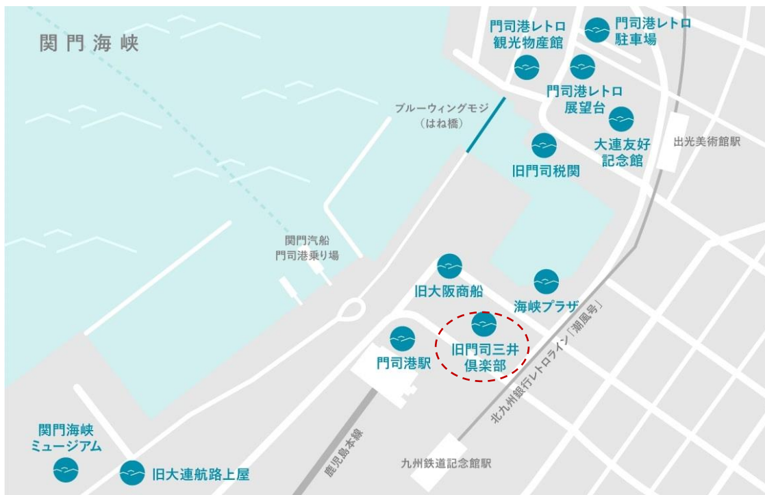
旧門司三井倶楽部 北九州市門司区港町7番1号