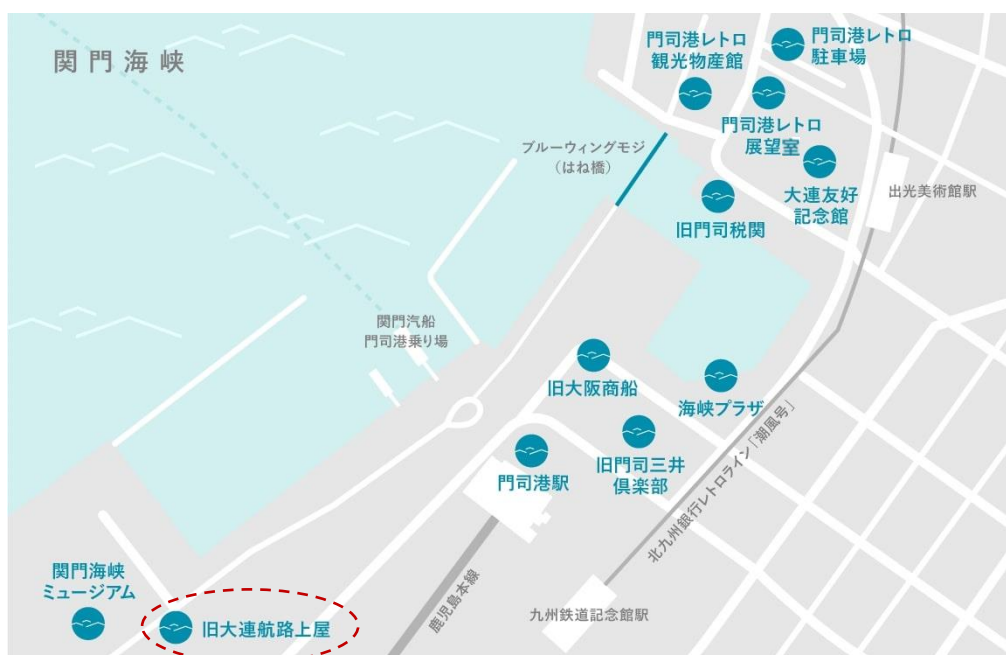
旧大連航路上屋 北九州市門司区西海岸 1 丁目 3 番 5 号

※多目的室 A-1、A-2 はパーティションで半分に仕切ることができます。片面の場合は半額となります。 ※多目的室 A-2 については、防音室となっています。