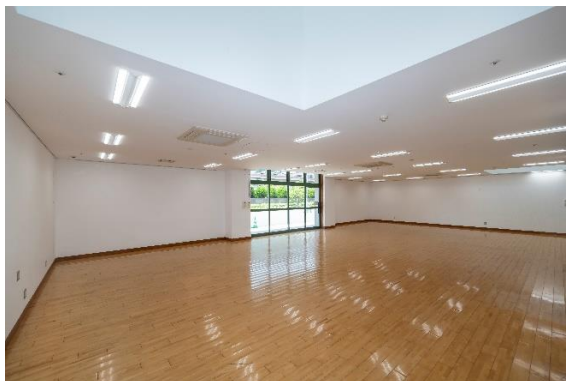
■多目的室 B(約 200 m 2 )