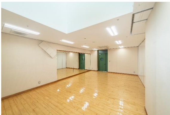
■多目的室 A-2(約 90 m 2 )