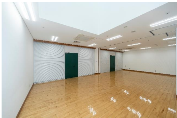
■多目的室 A-1(約 90 m 2 )